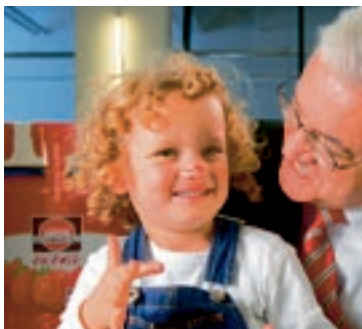
Stadtwerke-Kunde: Schwartauer Werke

„Auf dem veränderten Energiemarkt haben wir uns gut positionieren können, weil die Anteilseigner uns den notwendigen Spielraum gelassen haben.“