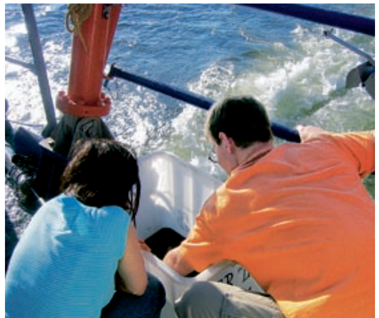
Der Unterricht wird zum Lokaltermin: Wasserprobenentnahme auf der Alkor bei voller Fahrt.

Der Wellingdorfer Biokurs war jedoch schon jetzt begeistert: Unterricht auf einem richtigen Forschungsschiff, Schule zum Anfassen, dazu mit realistischem Praxisbezug – das hatte schon etwas. Aber die jungen Forscher merkten auch, dass Wissenschaft eine Menge Fleiß und Geduld erfordert. Und nur selten sofort Resultate bringt – erst müssen die vielen Mosaiksteinchen, die sich im Verlauf der Untersuchungen ergeben, zusammengetragen werden. Und dennoch: Wissenschaftler und Schüler waren sich einig, dass eine solche Zusammenarbeit nachahmenswert ist. Und der Miesmuschel geht es immer noch prächtig.