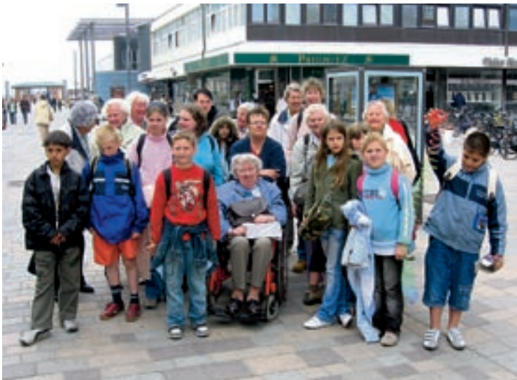
Gutes Team: Senioren und Kinder haben gemeinsam Spaß

durchschnitt gewaltig. Alle vierzehn Tage, und immer an einem Dienstag, lernen Jung und Alt gemeinsam – und alle, Schüler, Senioren und auch die beteiligten Lehrer erkannten schnell, dass man miteinander eine ganze Menge voneinander lernen kann.