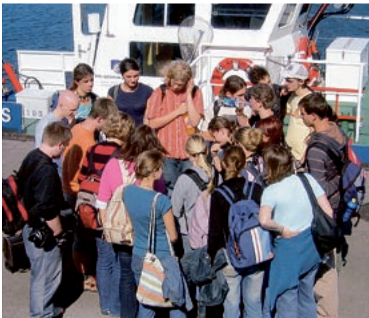
Lagebesprechung: Schüler und Lehrer legen fest, wer welche Untersuchungen vornimmt und wie die Resultate festgehalten werden.

ne ein völlig unbedenklicher Prozess. Doch wirkt sie sich eigentlich auf die dort lebenden Tiere und Pflanzen aus? Verändert sich der Sauerstoffgehalt? Wird die dort lebende Miesmuschel gar in ihrem Wohlbefinden beeinflusst? Wer das genauer wissen will, muss ins Labor gehen.