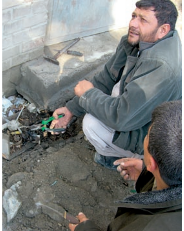
Immer unter Bewachung: In Kabuls Energieinfrastruktur liegt vieles noch im Argen.

men die Einwohner Kabuls mit Gleichmut hin. Ändern können sie daran ohnehin nichts, jedenfalls nicht sofort. Die Ausstattung mit Stromgeneratoren ist dafür umso besser. Diese rhythmisch vor sich hintuckern und stinkenden Geräte arbeiten Tag und Nacht.