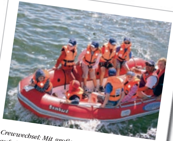
Crewwechsel: Mit großen Schlauchbooten können auf dem Wasser die Mannschaften ausgetauscht werden. Nicht nur praktisch - Spaß bringt's auch.