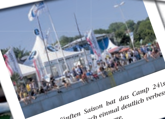
In seiner fünften Saison hat das Camp 24|sieben sein Angebot noch einmal deutlich verbessert. Dazu zählen auch neue Kurse.