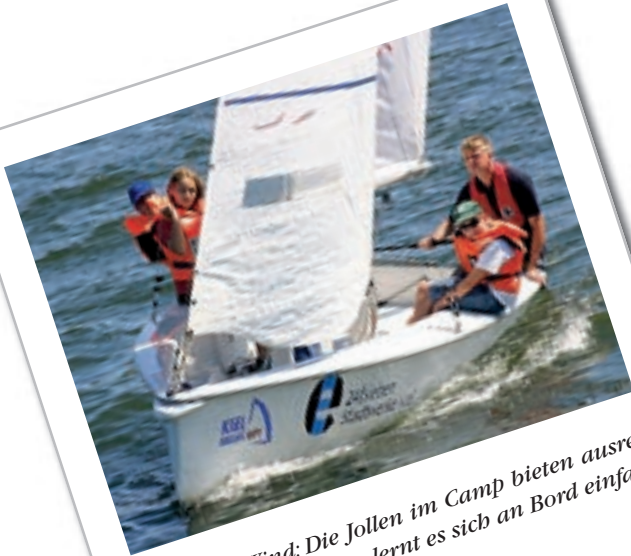
Hoch am Wind: Die Jollen im Camp bieten ausreichend Platz. Im Team lernt es sich an Bord einfach besser.