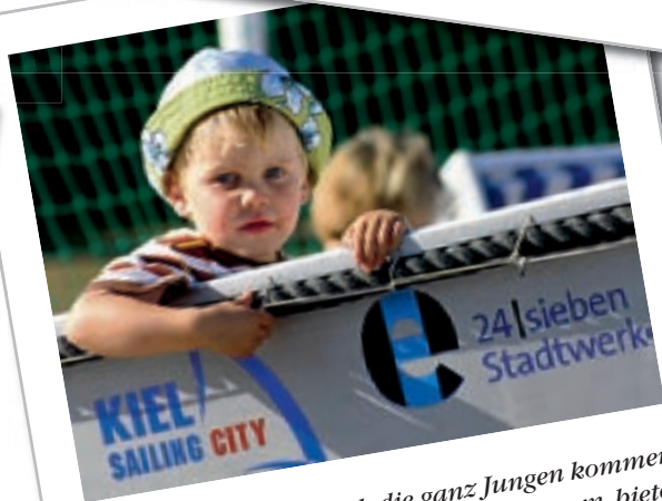
Erste Erfahrungen: Auch die ganz Jungen kommen im Camp auf ihre Kosten. Das Programm bietet für alle Altersgruppen das Richtige.