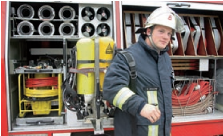
Engagiert: Stadtwerke-Azubis bei der Freiwilligen Feuerwehr

Veränderungen einzustellen. Unsere Anteilseigner haben uns in der Vergangenheit diesen Raum gelassen. Das ist um so bemerkenswerter, weil es keineswegs selbstverständlich ist. Gerade das Verhältnis zur Stadt Kiel ist von gegenseitigem Vertrauen und einer fruchtbareren Zusammenarbeit – und das geht weit über den Aufsichtsrat hinaus – geprägt.