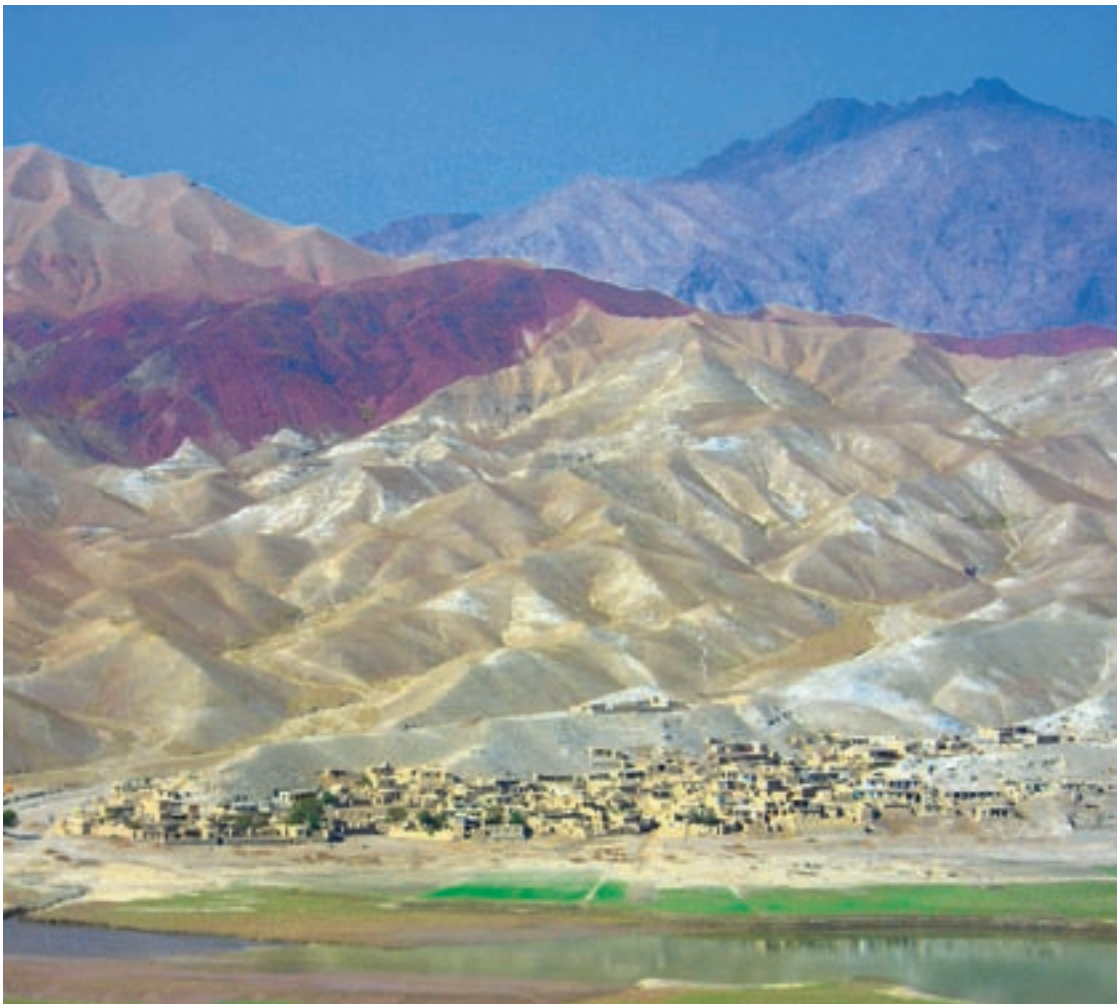
Kabul ist momentan noch weit davon entfernt, eine friedliche Stadt zu sein.

alter Autoreifen liegt in der Luft. Das Atmen fällt schwer. Vielerorts rattern Stromgeneratoren, das Dröhnen dieser Maschinen erfüllt die Umgebung. Es ist laut in Kabul, und über den Dächern liegt der Smog.