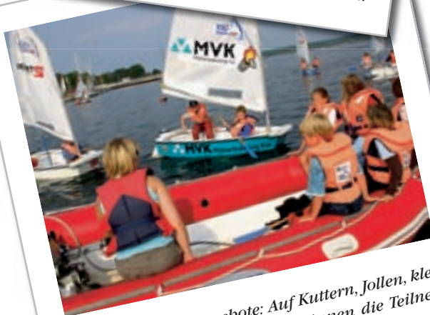
Kostenfreie Segelangebote: Auf Kuttern, Jollen, kleinen Yachten und Optimisten können die Teilnehmer die Förde vom Wasser aus erleben.