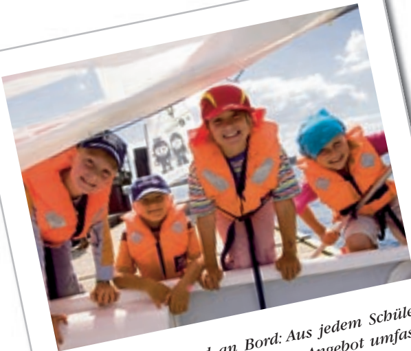
Spaß im Camp und an Bord: Aus jedem Schüler kann ein Segelkid werden – das Angebot umfasst Theorie an Land und viel Praxis auf dem Wasser.

Treiben auf dem Wasser und an Land. Kleine und große Segler können sich den Kieler Wind um die Nase wehen lassen und das Segeln lernen. Und so sieht es aus, wenn anstelle von Dreisatz und Vokabeln Halsen und Palstek auf dem Lehrplan stehen: