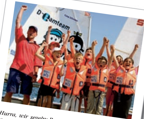
Hurra, wir segeln: Rund 7.000 Schüler lernen im Camp 24|sieben jedes Jahr, mit Pinne und Schot umzugeben. Insgesamt kommen 100.000 Besucher.