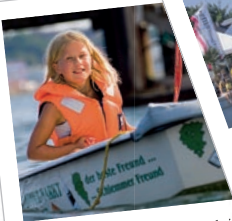
Immer mit Schwimmweste: Sicherheit steht im Camp 24|sieben noch vor dem Spaß an erster Stelle. Darauf achten geschulte Segellehrer.