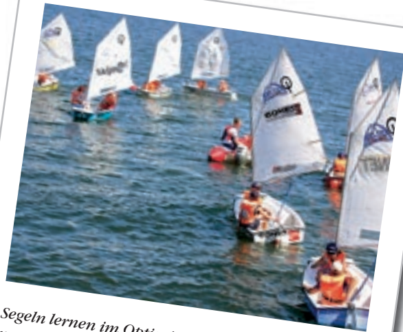
Segeln lernen im Optimisten: Das Jüngstenboot mit nur einem Segel ist ideal, um das Wenden, Halsen und Kreuzen zu erlernen.