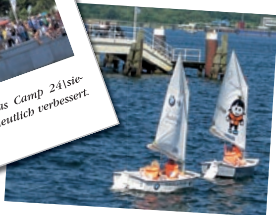
Mitten in der Kieler Förde, direkt an der Reventlowwiese, treffen sich seit 2003 Kinder, die sich für den Segelsport begeistern.