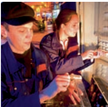
Auszubildende: Zwei von 91

Region definieren wir so, dass wir nach den Vertriebsfolgen unser Geschäftsfeld zunehmend eben auch in Norddeutschland sehen. So werden die Stadtwerke das bleiben, was sie schon immer waren: sicher, zuverlässig und norddeutsch.